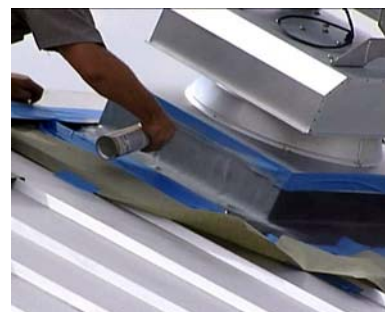
Figura 5 - Cómo Pintar el Recubrimiento

Su ventilador para ático solar con montaje de bordillo Attic Breeze está diseñado para montar directamente sobre el sistema de bordillo para techo y recubrimiento instalado. Consulte las instrucciones de instalación incluidas en su nuevo ventilador con montaje de bordillo Attic Breeze para terminar de instalar el producto.