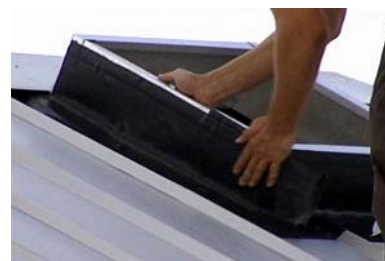
Figura 4 - Recubrimiento Lateral

Retire el reverso adhesivo del recubrimiento Wakaflex® y moldee el recubrimiento en su lugar alrededor de los laterales del bordillo para techo, como así también sobre la parte inferior del recubrimiento y las tejas del techo o la lámina metálica (ver Figura 4). Repita del otro lado del bordillo para techo.