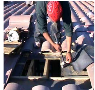
Figura 1 - Retire los listones

Con un sellador protector de intemperie para techos, aplique sellador alrededor de la parte inferior del bordillo para techo como se muestra en la Figura 2. Ubique el bordillo para techo sobre el orificio del respiradero, cuadrando el bordillo con las tejas del techo o las juntas alzadas. Con los tornillos autorroscantes incluidos, ajuste de manera segura el bordillo en su lugar con los componentes del encofrado, la cubierta o el contratejado metálico mediante la colocación de cuatro tornillos a cada lado del tapajuntas del bordillo para techo. Para las instalaciones en techos de tejas, aplique sellador a los tornillos de montaje y alrededor de la base del bordillo para techo. Reemplace las tejas del techo según sea necesario hasta el bordillo para techo instalado.