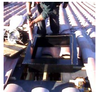
Figura 2 - Aplique el sellador